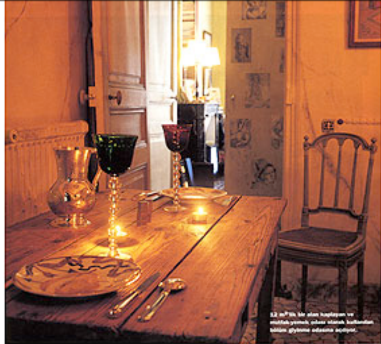
12 m²'lik bir alan kaplayan ve mutfak yemek odası olarak kullanılan bölüme giyinme odasına açılıyor.