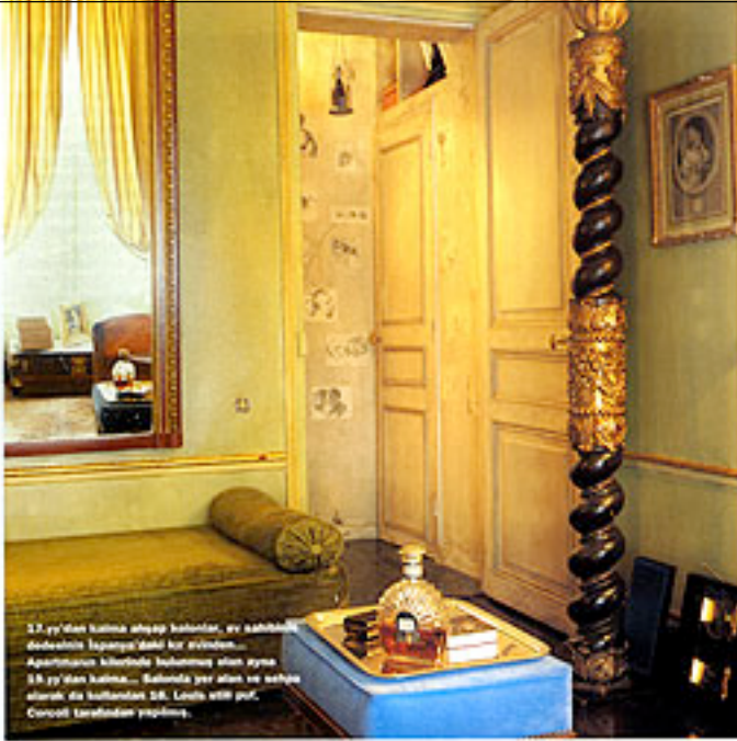
13. yy'den kalma aynaya bakarsak, 9. yüzyıla kadar uzanan bir evliliğin... Aparatörün kilitleri bu evliliğin aynasıdır. 13. yy'den kalma... Bahçede yer alan ve aynaya bakarsak da kullanılan 18. Lüks evli par... Corsoil tarafından yapılmıştır.

A t c de Trompe yükseklerdeki bu bane 1889'da inşa edilen bir apartmanda yer alıyor. Eskiden çarşıların yapıldığı idareye gire ve çarşılar, eskiden servis merdivenleri ve kileri açılan kapıları yapıyor. Oda, doğrudan şeklindeki odanın girişinde mutfak ve yemek masası yer alıyor. Giyinme bölümü ve banyo ise yatak odası olarak da kullanılan salonda mutfak alanına yerleştirilmiş.